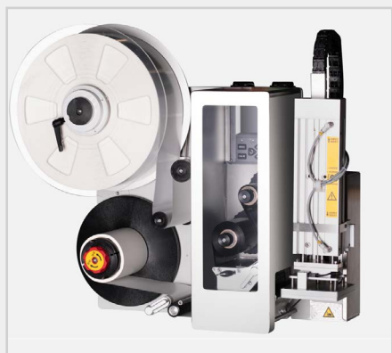
Etisoft PA430 – aplikacja bezkontaktowa (nadmuch):

Idealna do delikatnych, nieregularnych lub niestabilnych powierzchni, gdzie kontakt z produktem jest niepożądany.