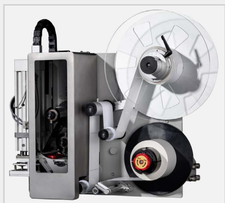
Etisoft PA431 – aplikacja kontaktowa (dotyk):

Idealna do delikatnych, nieregularnych lub niestabilnych powierzchni, gdzie kontakt z produktem jest niepożądany.